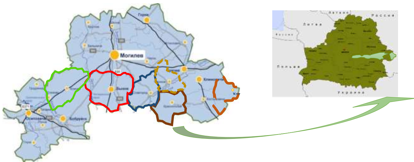
Рисунок 1. Географическое расположение пилотного региона.

Исходно, соглашение о сотрудничестве подписали Быховский, Кличевский, Краснопольский, Славгородский и Чериковский районы Могилёвской области 5 января 2018 года. 5 марта 2019 года к Соглашению о сотрудничестве присоединился Хотимский район Могилёвской области (рис. 1.). В дальнейшем, с согласия районов-партнеров, к ним могут присоединиться и другие районы, заинтересованные в межрайонном сотрудничестве и готовые внести вклад в общее развитие.